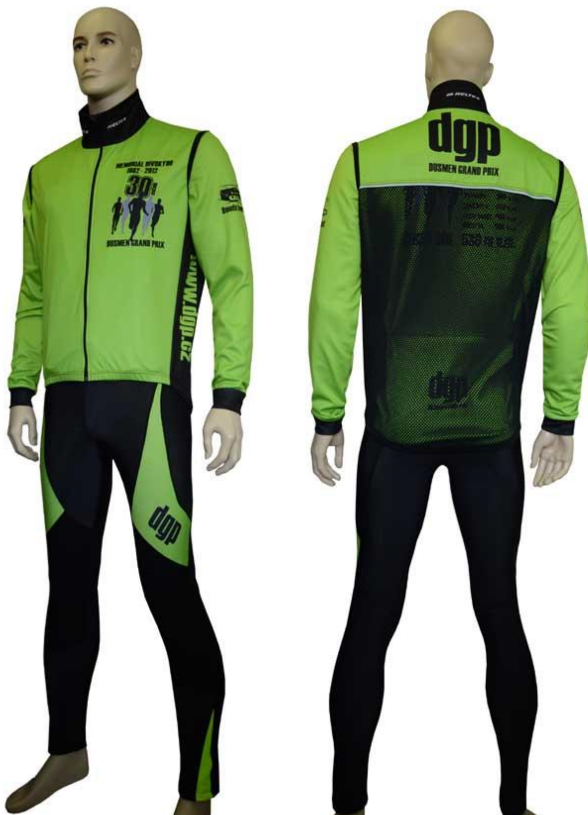
Náhled celého kompletu: bunda, vesta, kalhoty