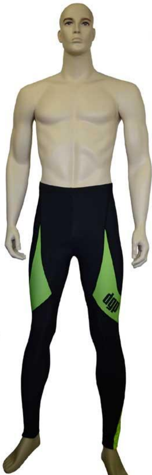
Artikl: 3a kalhoty pas Zateplené kalhoty bez laclu. Cena: 850,- Kč