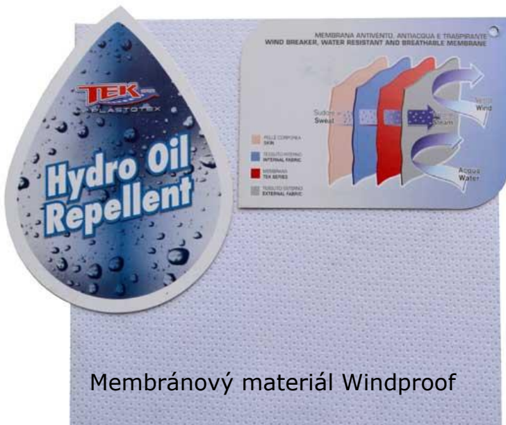
Membránový materiál Windproof

Popis: vesta s předním dílem, bočními díly a zadním vrchním sedlem z neprofukového materiálu – Windproof. Dlouhý rozvírací zip, zvýšený stojací límeček (Windproof) Pod sedlem v zadním dílu reflexní paspulka. Spodní část zadního dílu černá síťovina. Ve spodní části síťovaných zad je volitelně možné přidat třídílnou „cyklistickou“ kapsu.