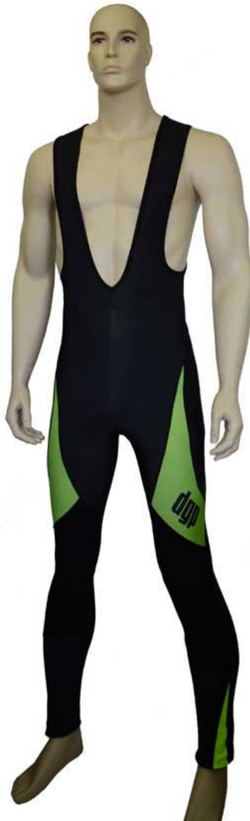
Artikl: 3b kalhoty lacl Zateplené kalhoty s laclem Cena: 900,- Kč